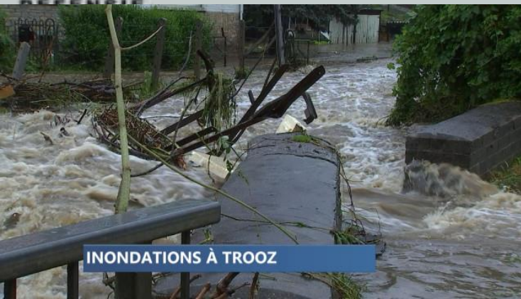
INONDATIONS À TROOZ